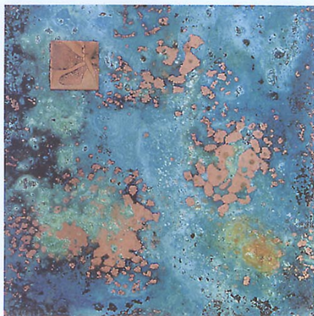
"Fragment av ett Äventyr I" Etsad och patinerad koppar på betsat trä, 20 x 20 cm.

Hennes dagar börjar redan på väg till ateljén med besök hos kemister och skrotupplag i jakt på nytt material till kommande verk. Hon skapar inte skrotkonst, men på skrotupplag finns billig metall som har repor, märken och personlighet. Kanske hittar hon en metallbit på bara några centimeter som hon förälskar sig i och bygger nästa konstverk kring. Hennes senaste verk är just ett sådant. Hon besökte en skrot och fann några kopparplattor som ett tryckeri hade kasserat. Blanka plattor med svarta linjer på. Först fick hon bara med sig ett par, men blev förälskad i dem och hämtade redan dagen efter de resterande 30 kilon som fanns. Hon ristar och etsar på metallplattorna som hon sedan fogar samman till ett större verk.