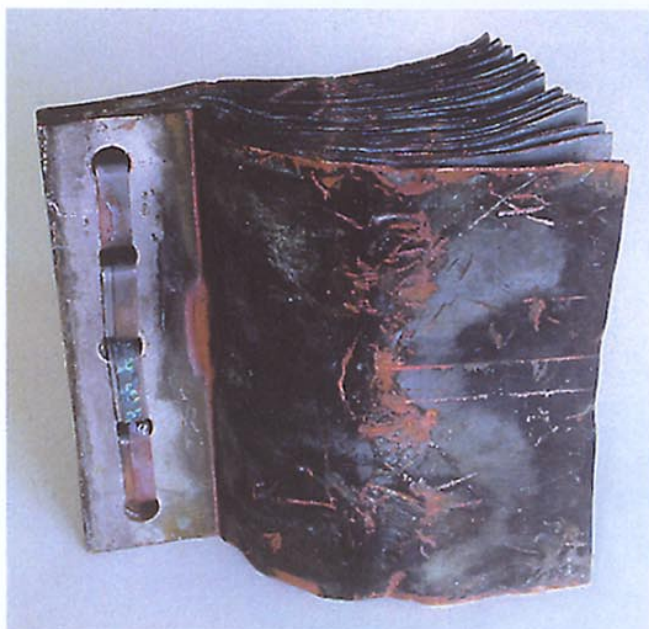
"Skæbneanekdoter" (Ödesanekdoter) Patinerad koppar, bly och tenn, ca 25 cm hög.