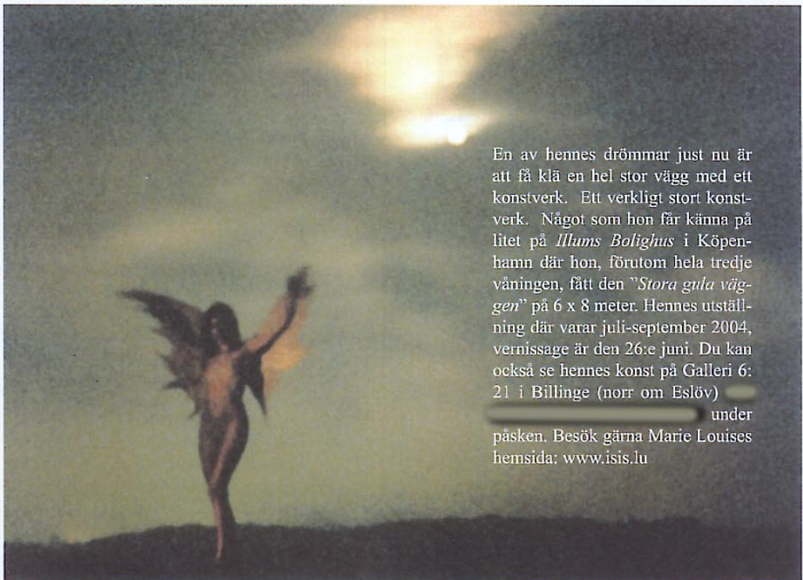
Fotografi under fullmån 2001