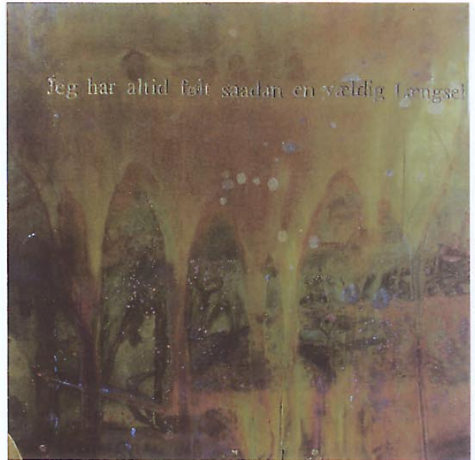
Etsad och patinerad mässing på betsat trä, 20 x 20 cm. "Fragment av Längtan"

Med hjälp av självutlösaren fotograferade hon sig själv under månen utan blixtn vilket gör att fotografierna får en trolsk och magisk inspiration. Ibland kom hästar och besökte henne och värmdde henne i den skånska kyliga natten. Så fort hon behövt bryta av vardagen har hon gett sig ut dit, till fältet. Bara varit sig själv, sprungit, hoppat och levt. Av alla foton hon tagit är bara några uppvisade - resten behålls för hennes egna ögon. Fotografierna lämnar ut henne på ett sätt som gör att man kan se hennes konst som bland det mest ärliga och rena.